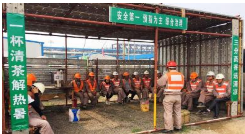
二分和空分工程分公司济宁宝钢气体项目开展送清凉活动