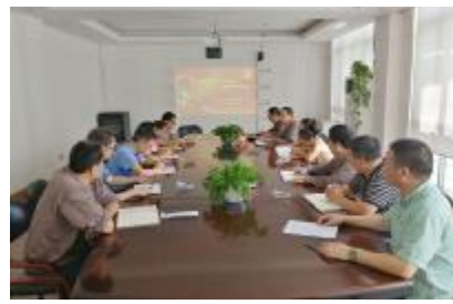
五分公司组织学习习近平总书记“7.26”重要讲话精神