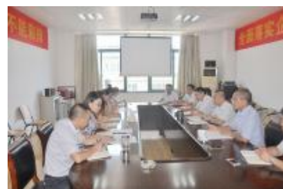
六分公司组织学习习近平总书记“7.26”重要讲话精神