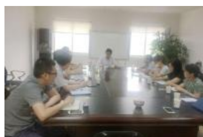
建筑安装分公司组织学习习近平总书记“7.26”重要讲话精神