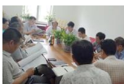
机电工程分公司组织学习习近平总书记“7.26”重要讲话精神