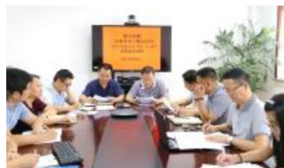
二分和空分工程分公司组织学习习近平总书记“7.26”重要讲话精神