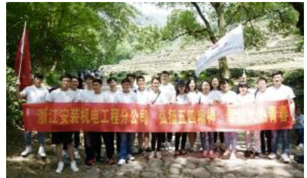
机电工程分公司毅行活动合影