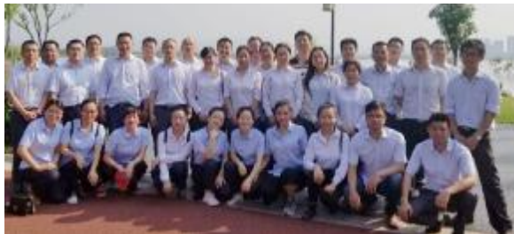
六分公司健行活动合影