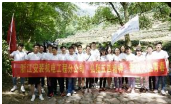
机电工程分公司毅行活动合影