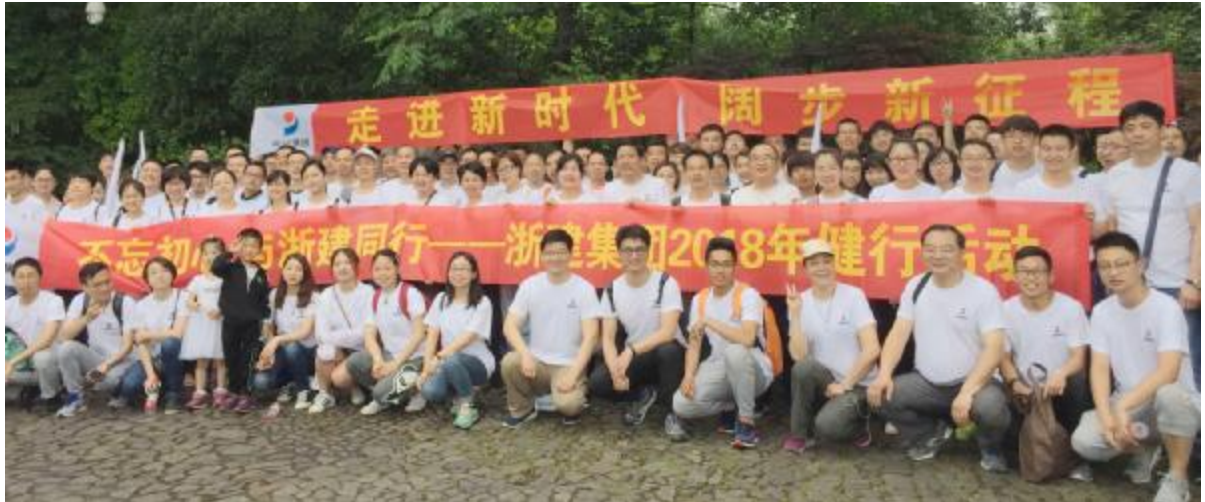
浙建集团职工健行活动合影