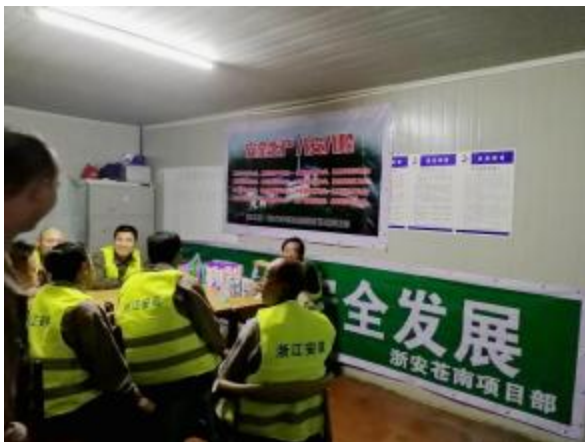
四分公司苍南项目组织施工人员进行安全知识竞答