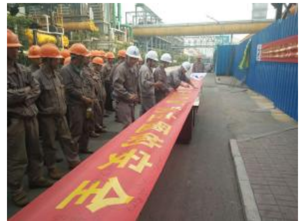
四分公司河北中煤旭阳项目开展安全生产签名活动