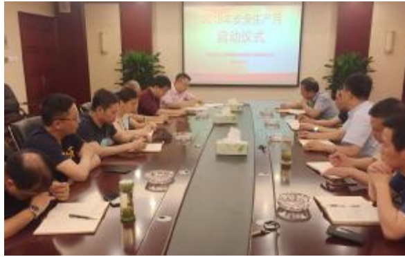
四分公司举行“安全生产月”活动启动仪式