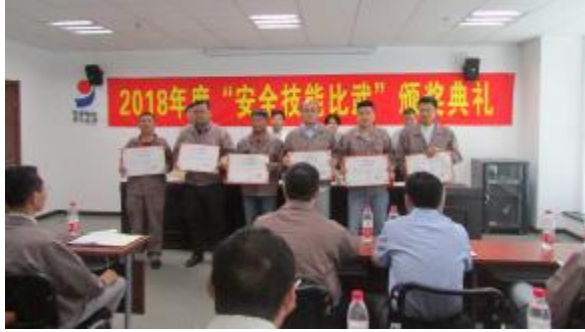
公司“安全技能比武”颁奖典礼

为弘扬全国2018年安全生产月“生命至上 安全发展”主题，增强全员安全意识，提升全员安全素质，公司及所属各分公司项目部积极开展安全技能比武、签名宣誓、应急演练等安全生产月活动，现摘取部分活动照片，以飨读者。