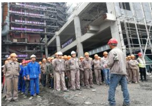
四分公司瑞安项目举行安全生产月启动仪式