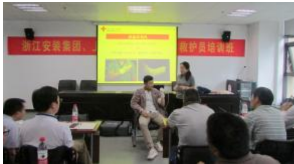
公司联合杭州市上城区红十字会举办救护员培训班