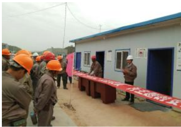
四分公司陕西志丹项目举行安全签名活动