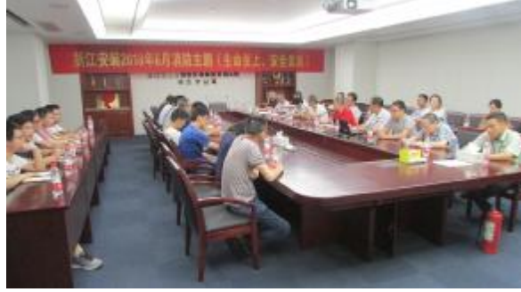
三分公司举办消防安全知识培训