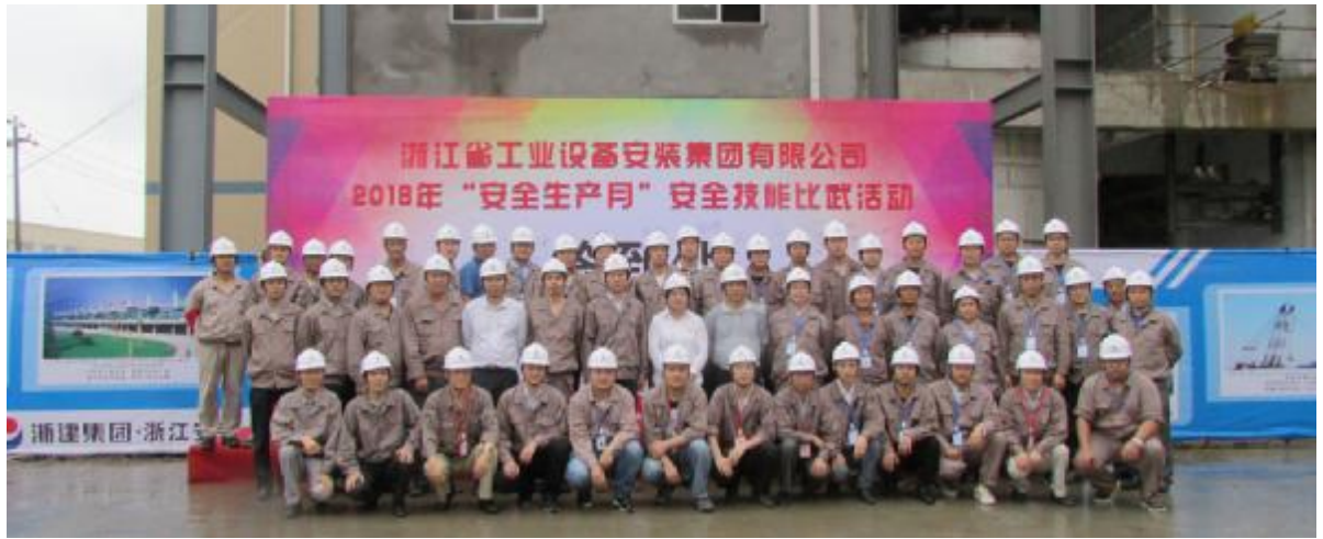
公司举办2018年“安全生产月”安全技能比武活动