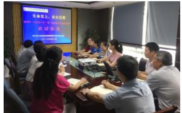
北京分公司举行“安全生产月”活动启动仪式