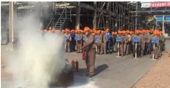
二空分公司中天合创项目开展消防实操培训