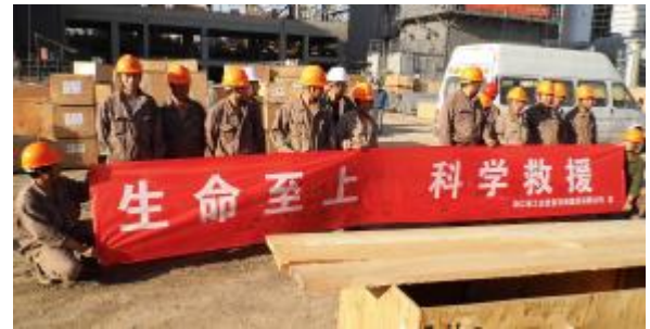
二空分公司河北纵横空分项目开展安全签名和消防演练