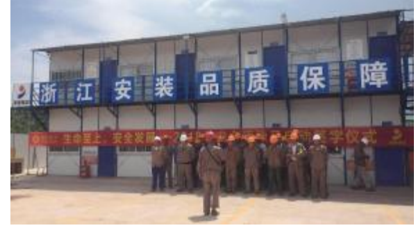
四分公司广西博白项目举行安全签名活动