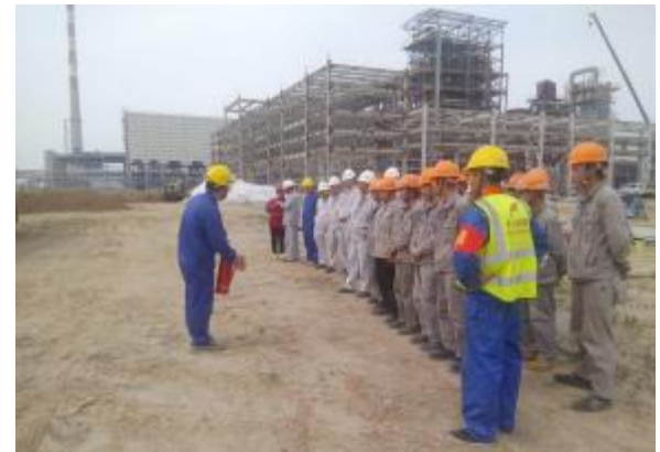
上海分公司山东新和成项目开展消防演练