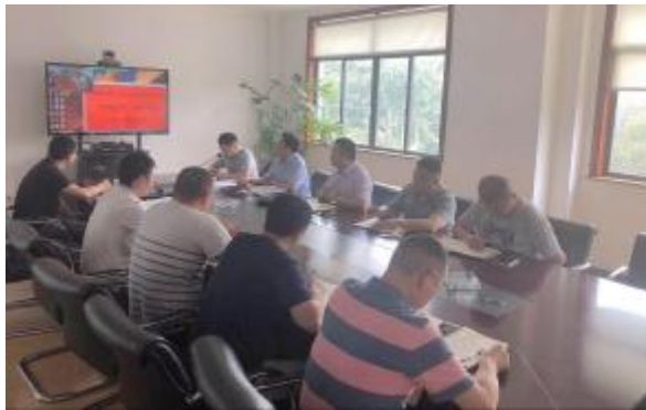
二分和空分工程分公司召开“安全生产月”活动启动会议