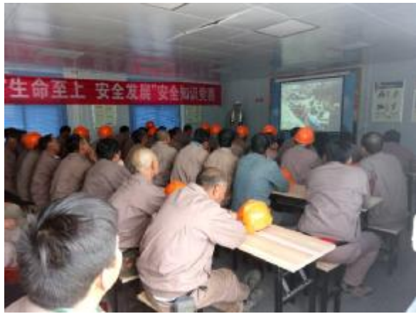
四分公司青海大美项目组织学习安全知识